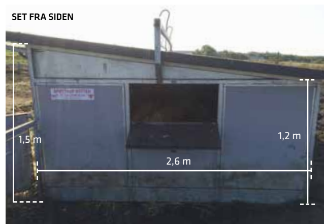
SET FRA SIDEN

På hyttens forside kan der fastmonteres galvaniserede rionet i ramme (5 x 0,82 meter pr. fag), som udgør en træningsfold til brug i dagene lige efter fravænnning. Træningsfolden består af 12 fag, der kan sættes sammen, og stilles i den formation man ønsker.