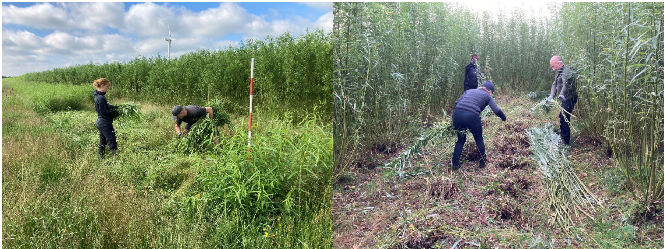
Udbyttemåling i pileklonen Tordis hhv. 24. juni og 24. september 2021.

Ét af elementerne i projektet er at se på, hvor meget biomasse træerne producerer, hvor store mængder næringsstoffer der kan fjernes med biomassen, og om biomassen kan ensileres og bruges til foder til grisene. Derfor er der i sommeren 2021 anlagt flere markforsøg i pil og poppel med fokus på disse forhold. Forsøgene er anlagt hos Ny Vraa Bioenergy og gennemføres i samarbejde med Teknologisk Institut, Center for Frilandsdyr og Aarhus Universitet. Der er bl.a. anlagt forsøg i marker med pileklonen Tordis og poppelklonen OP42. I begge forsøgsmarker blev træerne høstet i vinteren 2020/2021, og i forsøgsparceller er der høstet nye skud med blade enten 24. juni eller 24. september 2021. Der er målt udbytte og næringsstofindhold, og biomassen er brugt i ensileringsforsøg.