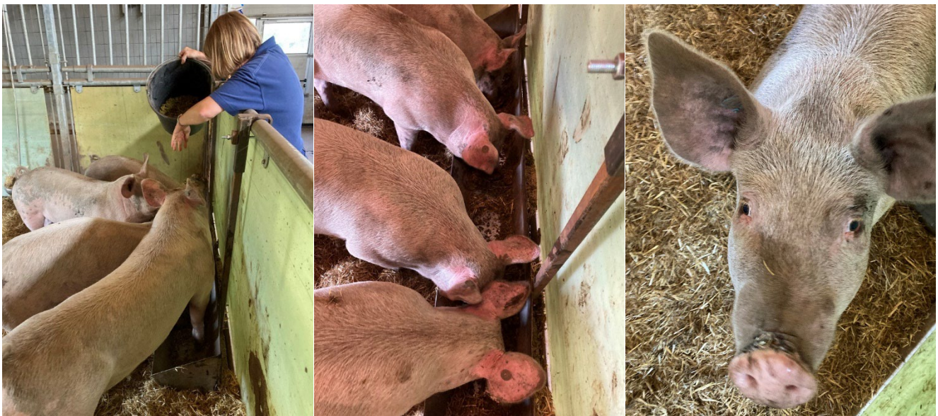
Indledende 'smagstest' med ensilage af pil og poppel til slagtesvin.

Foderværdien af den høstede pil og poppel er meget vigtig for, hvor interessant biomassen er som foder til grise. Derfor laver Aarhus Universitet analyser af foderværdien af pile- og poppelensilage. Derudover er det naturligvis afgørende, om grisene har lyst til at æde ensilagen, og dette vil også blive undersøgt senere i projektet. Der er dog allerede lavet en lille indledende 'smagstest' med slagtegrise på Aarhus Universitet, der blev præsenteret for forskellige typer ensilage. Og umiddelbart tog grisene godt imod denne nye specialitet.